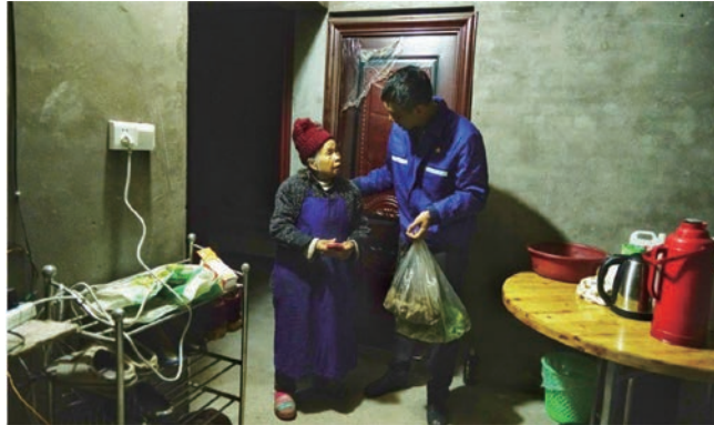
2019年4月，川能屏山電力在屏山縣富榮鎮油房村開展宣傳扶貧政策活動。活動中，員工向村民講解安全、衛生、環保知識，並發放春耕化肥和農產品。