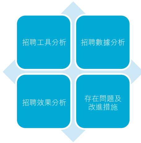
圖：招聘效果評估的主要內容

我們在《四川能投發展股份有限公司員工聘用管理辦法》中設有不得聘用年齡未滿18周歲人員的條款，並在資格審查、背景調查等流程中通過核驗身份證明信息等方式杜絕僱傭童工情況的發生。如發現虛假填報個人信息的情況，集團將不予錄用。