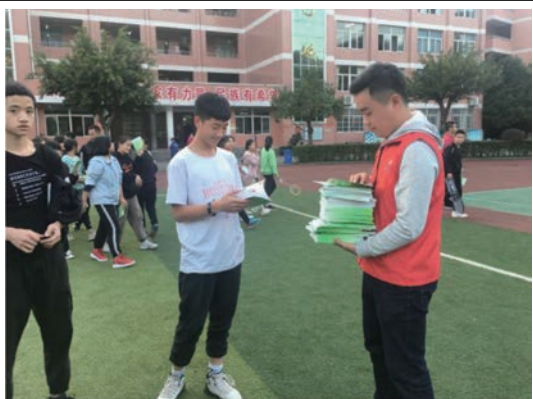
2019年11月，川能興文電力走進興文縣香山中學開展「安全用電進校園」宣傳活動。活動中，我們為學生講解家用電器安全知識，並發放了《家用電器安全用電常識》等宣傳資料，提高學生和家長們的安全用電意識。