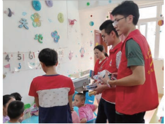
2019年7月，川能宜賓售電的志願者服務隊走進宜賓市兒童福利院，為兒童捐贈學習用品，陪伴兒童做手工等，為特殊群體兒童送上關懷與溫暖。