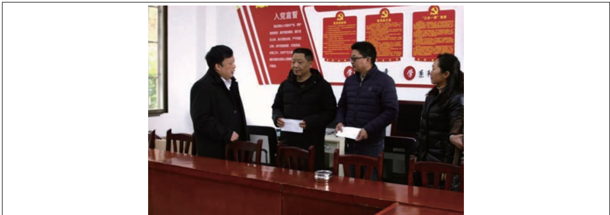
2019年1月，川能宜賓電力為貧困群眾送去春節慰問物資和慰問金。