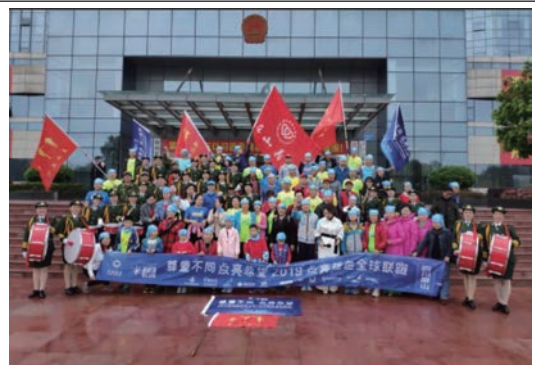
2019年4月，川能屏山電力組織員工參與「世界孤獨症日一點亮藍色全球聯跑」活動，旨在提高社會對孤獨症兒童的關注，身體力行助力愛心公益。